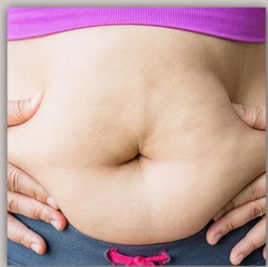
EFFICACE CONTRO CELLULITE E RITENZIONE IDRICA

Insieme al magnesio, nano gocce di potassio è un integratore che meglio contrasta gli effetti della sudorazione eccessiva (soprattutto d'estate) e l'affaticamento muscolare.