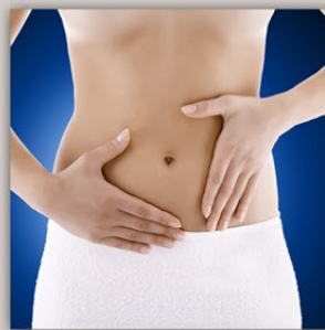
OTTIMO AIUTO CONTRO IL GONFIORE ADDOMINALE